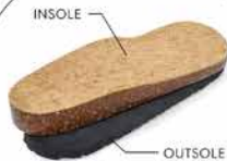
STRUKTUR KUAT + RINGAN