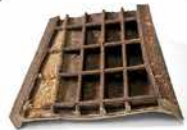
MATERIAL BIOSOLE 30% ULTRA-RINGAN

"Kenyamanan maksimal dengan berat minimal, nyaman seperti berjalan di atas awan."